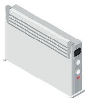
Обігрівач масляний 2,2 кВт/год.