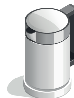
Електрочайник 1,9 кВт/год.