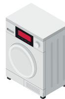
Сушильна машина 3,3 кВт/год.