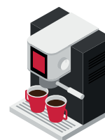
Кавоварка 1,1 кВт/год.