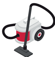
Пилосос 1,9 кВт/год.