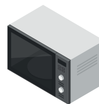
Мікрохвильовка 1,1 кВт/год.