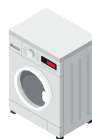
Пральна машина 2,1 кВт/год.