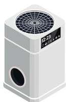
Бойлер 2,1 кВт/год.