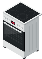
Варильна поверхня 7,5 кВт/год.