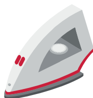
Праска або фен 1,7 кВт/год.